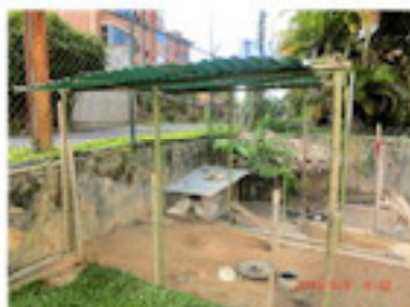
屋根が完成したウサギ小屋（9月）