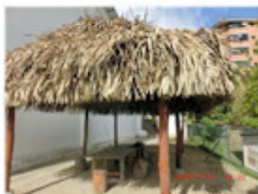
完成したラ・ブリッサ（7月）