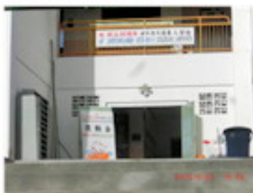
運動会に向けて看板製作 (6月)