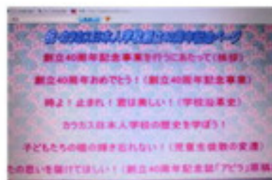
創立40周年のページ