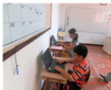
ノートPCを教室で活用（8月）