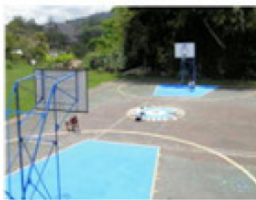
コートの塗装を行う（8月）