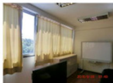
カーテンも新調（8月）