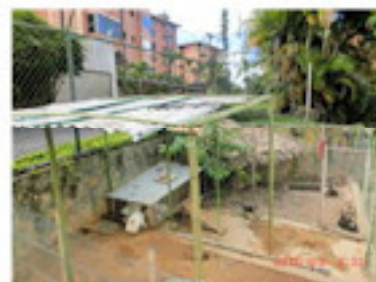
これで雨でも大丈夫（9月）