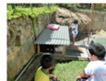
ウサギの飼育開始（8月）