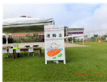
運動会当日は会場に設置 (6月)