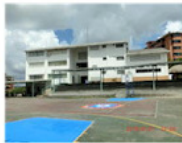
塗装後の校舎とコート（8月）