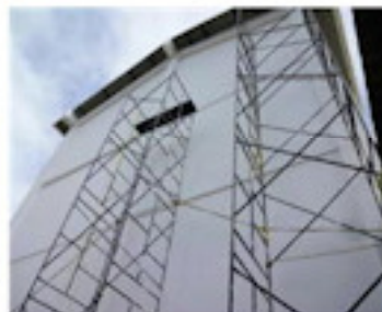
3階まで塗装する（8月）