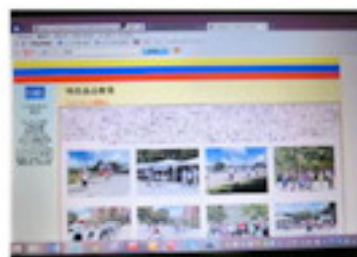
特色ある学校のページ