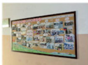
学校の1年間が掲示板に（1月）