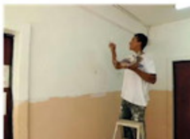
廊下の壁を塗る（8月）