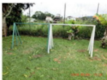
色はグリーンとホワイト (10月)