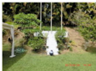
掲揚台を美しく整備 (6月)