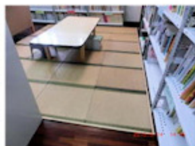
畳コーナーに木枠を設置（9月）