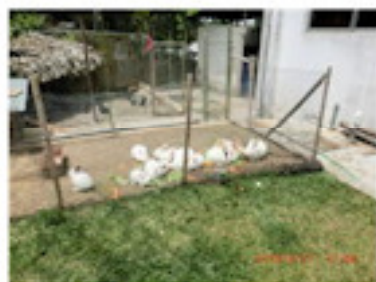
屋根がなかった頃の小屋（4月）