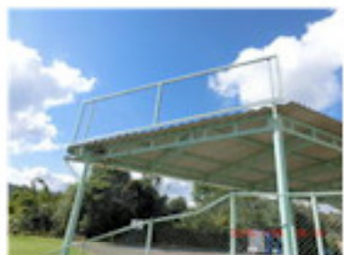
観覧席屋根にフェンス（1月）