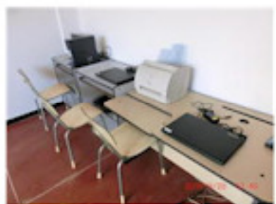
ノートパソコン2台購入（8月）