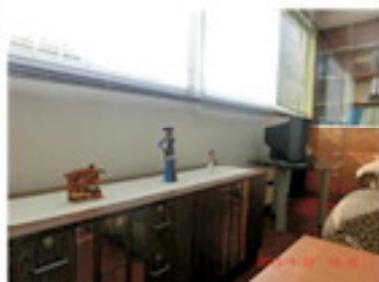
ブラインドも再利用（3月）