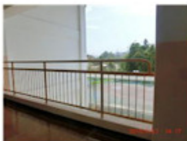
ロッカーを整理し、すっきり (6月)