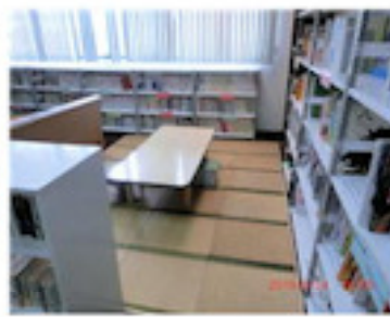
居心地のいい畳コーナー