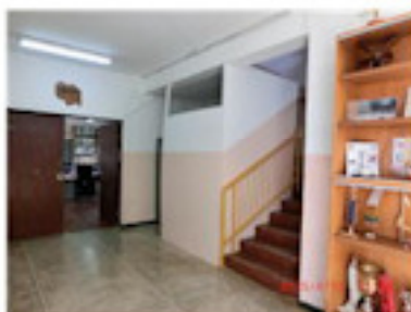
手作りの更衣室完成 (4月)