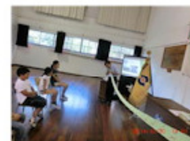
創立記念日を祝う集会 (10月)