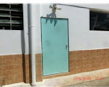
体育館の外扉も全部（8月）