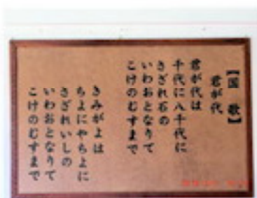
日本国 国歌額完成（2月）