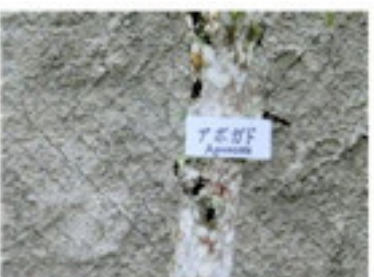
樹木名札の設置 (12月)