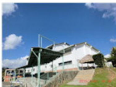
空いていた穴も塞ぐ（1月）