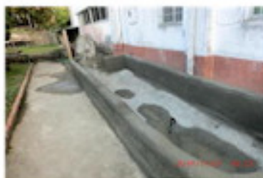
形が出来上がる（11月）