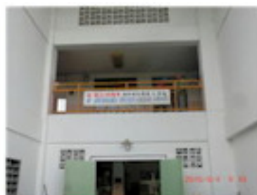
創立40周年看板設置 (6月)