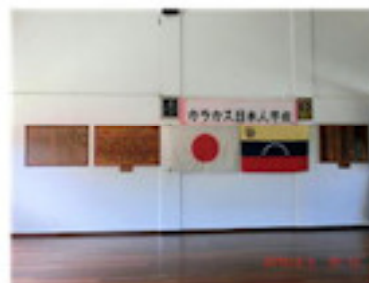
日本国国歌・ベネ国歌・校歌（2月）