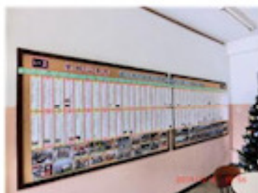
完成した学校沿革史 (12月)