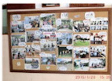
4枚の掲示板で1年間（1月）