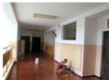
廊下の壁を塗る（8月）