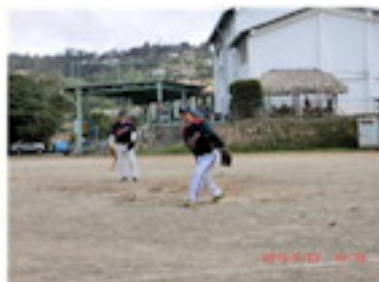
ソフトボール大会でも安心（2月）