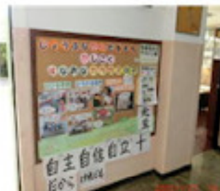
校長先生の掲示板（1月）