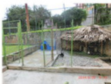
その隣りにウサギ小屋（8月）