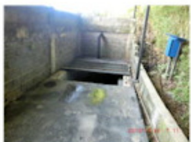
汚水槽の内部工事 (11月)