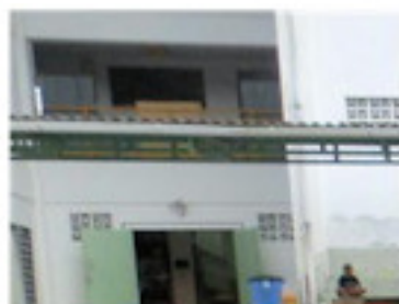
整備前は物でいっぱい