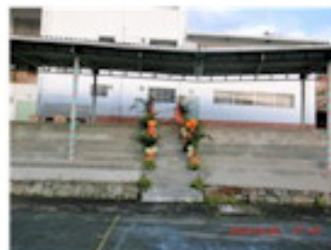
修理なった階段（8月）