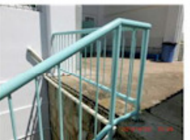
手すりも見違える（8月）