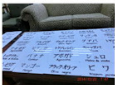
樹木名札の製作 (12月)