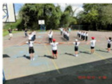
色あせたコート（6月）