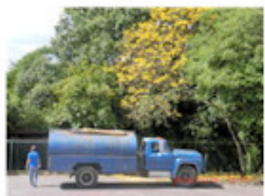
工事前に汚水を抜く (11月)