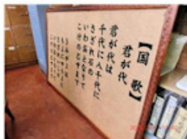
手作りの国歌額（2月）