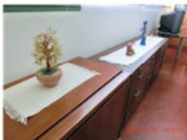
ベネ産の人形を飾る