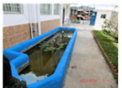
観察池を再塗装（8月）