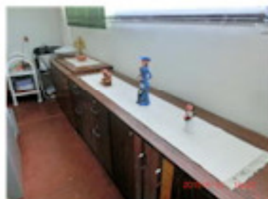
寄贈していただいた飾り櫃（3月）