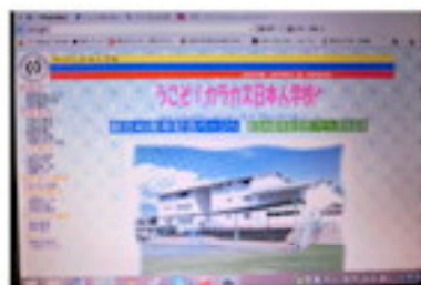
表紙も内容も一新