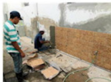
タイルも全て新しく（8月）