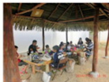
全校で毎日お弁当（7月）