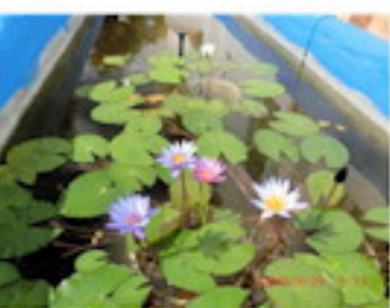
観察池は睡蓮の池に（8月）