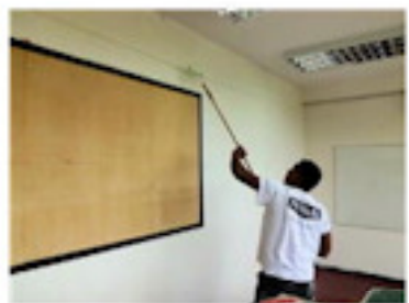
教室の壁を塗る（8月）