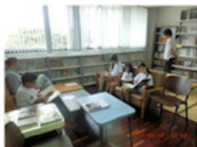
以前は畳が未固定でした