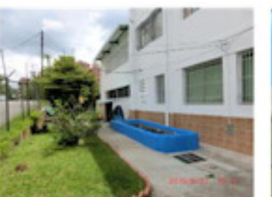
真っ白な校舎と青い池