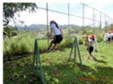
体育の授業で活用しています