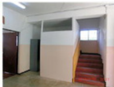
周囲とも調和して美しい