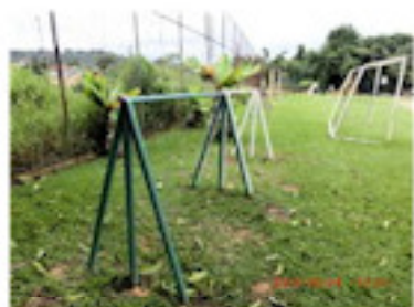
高学年用鉄棒2基完成 (10月)