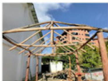
改築中のラ・ブリッサ（7月）