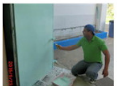
用務員さんの作業で（8月）