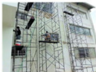
足場を組み立ての大工事（7月）