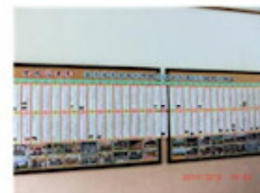
一目でわかる40年の歴史 (12月)