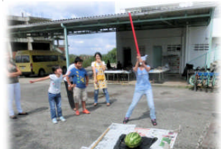
今年はスイカ割りをみんなでしました。大盛り上がりでした！