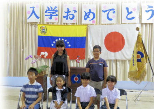
これで全校児童は6名です。世界一楽しい学校にします！