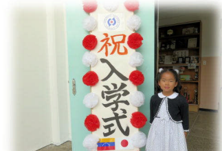
入学式の看板の前で、新入生の記念写真です。最高の笑顔！