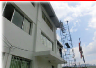
4月27日 雨樋の大修理をしました。これで大丈夫です！