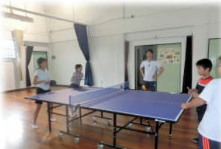
4月22日 新しい先生と一緒に卓球ダブルスに挑戦です！