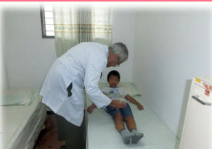
4月27日 アハルル先生の内科検診。有り難うございます！