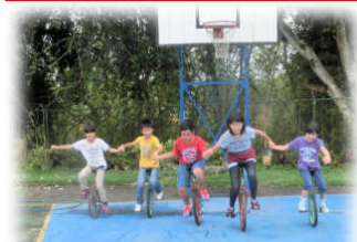
5月5日 みんな一輪車に夢中です。見よ！この勇姿を！