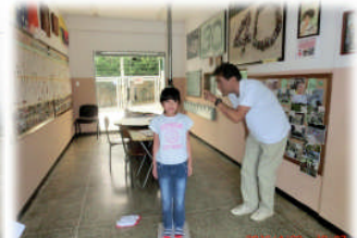
4月22日 新学期になって初めての身体測定です！