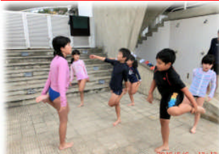
5月6日 水泳教室スタート！1・2学期で11回行います。