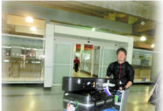
4月9日 竹永先生が元気にカラカスの空港に到着しました！