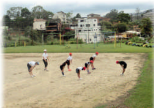
4月22日 快晴の日、全校6人と先生とで体育をしました！