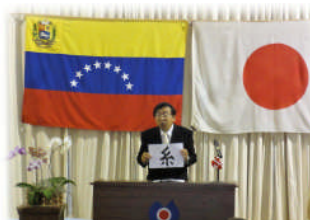
始業式では校長先生から「糸」に因んだお話がありました！