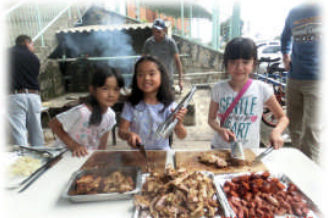
午後は楽しく、美味しい大好きなPTAパーティーでした！