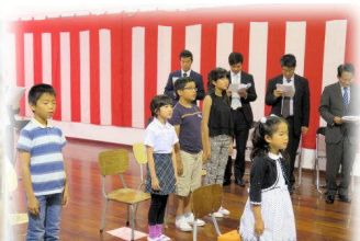
入学式は2年ぶりです。学校がばあっと明るくなりました！