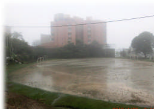
4月20日 今日は大雨です。運動場がまるで池のようです。