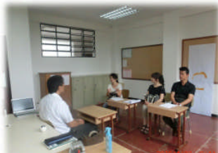
4月23日 年度始めの授業参観、懇談会を開催しました！