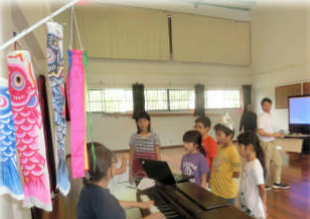
5月5日 「こどもの日集会」みんなで「鯉のぼり」を歌う！