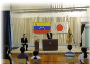
4月14日 着任式。新しい先生をみんなで歓迎しました！