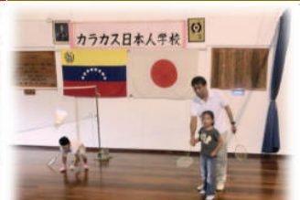
5月12日 新しい試み、クラブ活動が始まりました！

カラカス日本人学校の1学期の美しい時間の物語を、今までに載せたことのない写真で3回に分けて連載します。