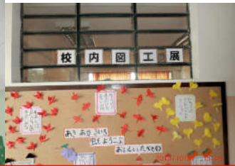
2階廊下では、並行して「校内図工展」を盛大に開催しました。