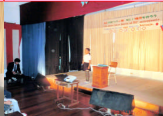
この4月に入学したばかりの1年生の素晴らしいパフォーマンス。