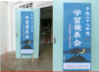
手作りが日本人学校の伝統です。看板ももちろん手作ります。

時よ！止まれ！君は美しい！ 小さな舞台で生まれた、大きな感動と希望の物語！ ~創立41年目の発表会①~