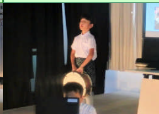
自分の目で見たこと、心で感じたことを自分の言葉で発表。