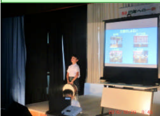
③小学部3年 国語「つたえよう、楽しい学校生活」