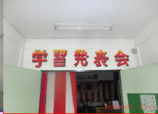
この紅白幕の向こう側で、2016年の新しい物語が始まります。