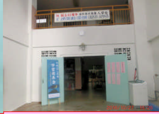
玄関には看板と、児童全員の「学習発表会の目標」を掲示。