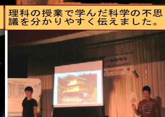
歴史上の人物にインタビューするといふ夢のような、楽しい演出。