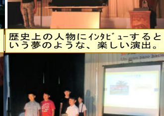
7月に行った「メリダへの旅」を自分たちの感性と言葉で発表。

育ってます！ グローバル人材の卵①大勢の前でも堂々と発表できるプレゼン力 ②意欲的・積極的に、自分の頭で考えて行動し、自分の言葉で発表できる思考力 ③何でも一生懸命に、誠実に取り組み、何でもこなす巧み力