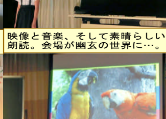
大好きな動物のことを写真と絵を使って、堂々とプレゼン。