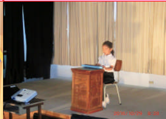
①はじめの言葉 小学部1年 元気いっぱいの挨拶でスタート