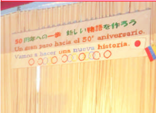
児童の考えたスローガン「50周年への一歩 新しい物語を作ろう」 Un gran paso hacia el 50º aniversario. Vamos a hacer una nueva historia.