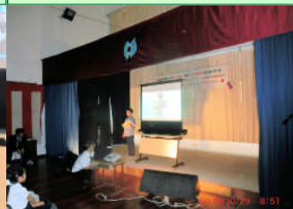
④小学部4年 理科「空気と水の体積の変化」