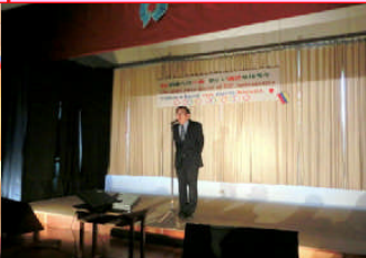
②学校長の話「グローバル人材の卵」が育っている姿を見てください