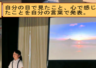
映像と音楽、そして素晴らしい朗読。会場が幽玄の世界に…