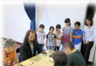
10月10日 囲碁大会が本校を会場にして開催されました！