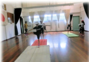
9月30日 マット運動でY字バランスに挑戦しました！