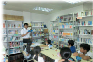
10月7日 全校読書集会。全校の読書意欲を喚起しました！