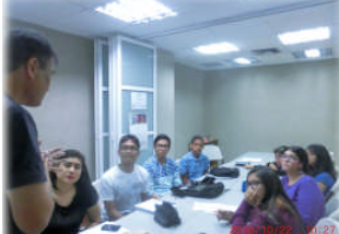
10月22日 日本語教室で、発表の練習の手伝いをしました！