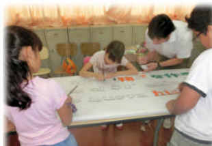
10月7日 学習発表会のスローガンをみんなで製作中です！