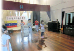
10月24日 学習発表会最終盤の練習です(合奏の練習)！