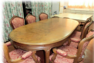
10月5日 寄贈していただいた家具で家庭科室がお城の様に！