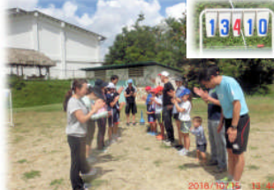
親子スポーツでは、手に汗握る熱戦が繰り広げられました！