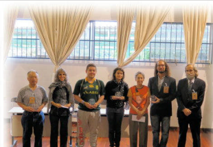
中南米、欧州各国から一流の棋士が参加されました！