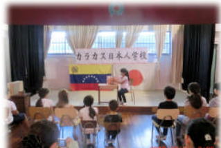
10月15日 フリー参観日。読み聞かせ会でスタートです！