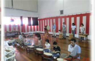
10月25日 学習発表会最終盤の練習です(和太鼓の練習)！