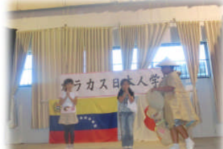
10月20日 全校スペイン語劇の練習にも熱が入ります！