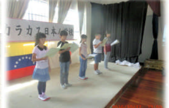
10月17日 学習発表会の練習にも熱が入ってきました！