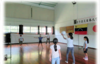
10月7日 休み時間にソフトボールでいい汗を流しています！