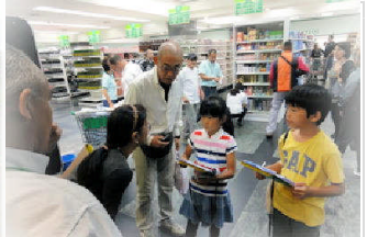
10月3日 近くのスーパーマーケットへ社会見学に行きました！