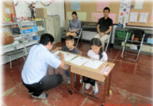
体験入学者が3名もいて、学校は大にぎわいです！