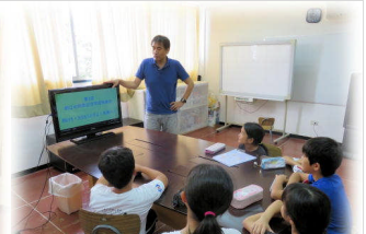
10月14日 全校学活。学習発表会に向けての話をしました！