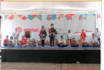
2月18日今年も日本文化週間で堂々と和太鼓発表しました！