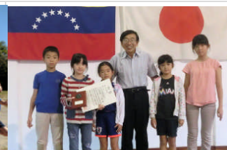
1月13日海外子女文芸作品コンクールで見事、入賞しました！