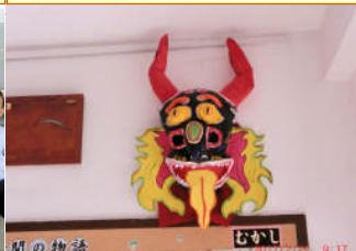
2月22日マリア校からの贈り物を玄関に飾りました！