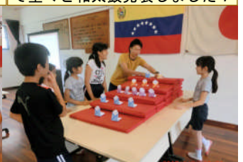
3月3日全校ひなまつり集会。みんなで雛人形を作りました！