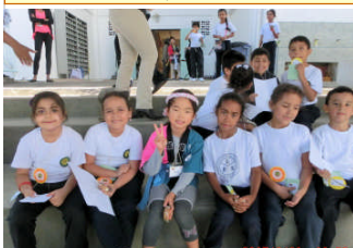
2月21日マリア校交流。子どもたちには国境はありません！