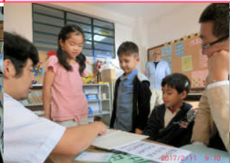
2月11日第3回体験入学。4人も体験入学し、楽しかった！