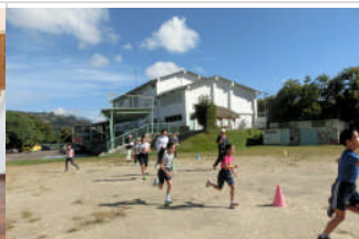
1月13日アビラ登山を目標に、全校持久走が始まりました！