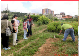
1月16日近くの郵便局や農園へ社会見学に行きました！