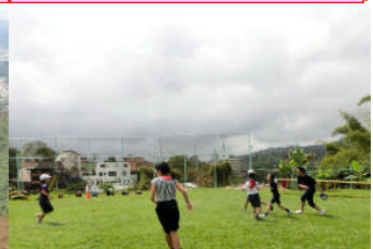
2月3日全校節分集会。元気よく。鬼ごっこをしました！