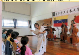
3月2日第2回音楽鑑賞会。コントラスの素晴らしい演奏！