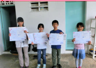
2月14日英語検定の合格証を授与。誇らしげな顔、顔…。