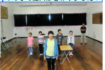
3月10日卒業式練習が始まりました。2016年度もラスト！

世界一楽しい学校！を子どもたちと一緒に目指して、奮闘してきた懐かしく、愛おしく、充実した日々よ！