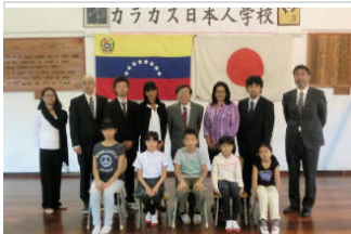
1月10日3学期始業式。2017年新年をベネズエラで迎えました