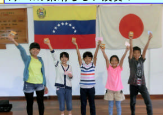
3月10日進級を祝う集会。みんなの頑張りにチョコパイで乾杯！