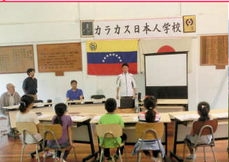
1月20日アビラ登山に向けての学活。児童を勇気づけました！