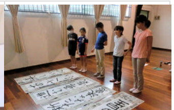
1月13日お正月集会。今年は今全校で書き初めをしました！