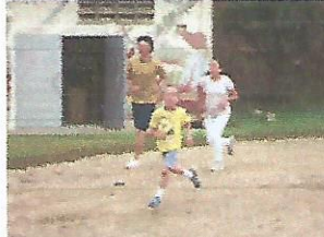
Corriendo por la mañana

6月23日に行われる運動会に向けて、あいさつ練習や応援練習、体力向上ランニング、ダンス、花笠踊りの練習など、子どもたちは頑張っています。