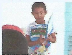
Aprendiendo el alfabeto

☆ バス帰りの会の時に、ミニ発表会を行っています。学習したことをみんなの前で発表しています。