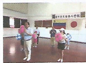
Danza tradicional HANAGASA