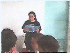
Lee la composicion