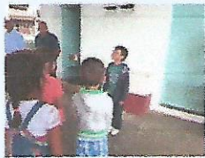
Lee la table de multiplicar