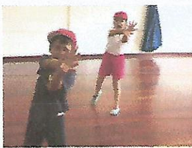
Práctica de animar al equipo