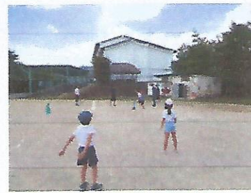
Los niños jugando béisbol