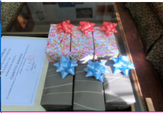
永年勤続者の記念品の腕時計は日本で購入してきました。