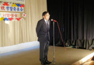
②学校長の話 1 部から 4 部まで 1 日ゆっくり楽しんで下さい