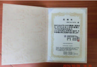
永年勤続者に授与する感謝状です。日本語と西語の併記です。