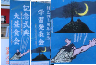
手作りが日本人学校の伝統です。看板ももちろん手作りです。