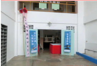
そして、いよいよ 10 月 31 日 (土) の朝を迎えました。