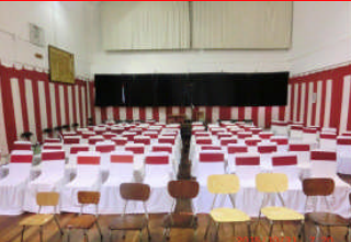
観客席 100 席以上の準備もできました。特別の椅子です。