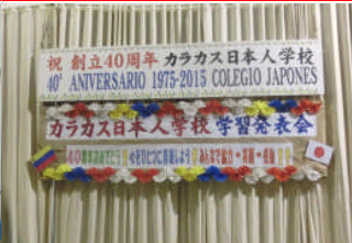
舞台の準備も万全です。看板とスローガンが掲げられました。