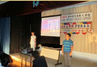
⑥小 5 国語「春夏秋冬」日本の四季の素晴らしさが伝わったね