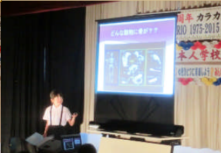
⑤小 4 理科「骨のある動物」写真を使ってわかりやすかったね