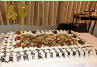
大昼食会の時に食べる大きなケーキも届きました。美味しそう