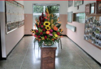
創立 40 周年、ベネズエラらしい鮮やかで、美しい花です。