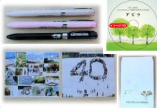
心を込めて作製した創立 40 周年記念品の準備もできました。