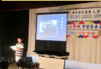
④小 3 国語「つたえよう楽しい学校生活」上手に伝えられたね