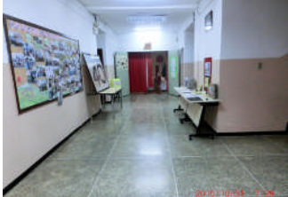
廊下に展示物、掲示物が勢揃いしました。いよいよ始まります