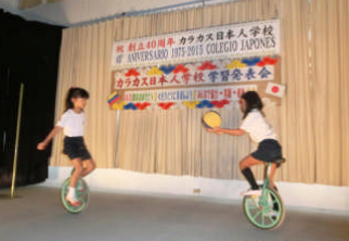
③小 2 体育「一輪車の実演」まるで曲芸、素晴らしいパフォーマンス