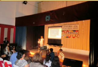
⑦小 3 ~ 5 総合「修学旅行体験記」感動を上手に伝えられたね

創立 40 周年を迎えた本校の伝統 ①創意工夫 (何でも手作り、物も人も大切にすること) ②みんなが家族のように (子どもたち・先生・保護者・関係者が強く結びついている) ③国際性豊かな子ども (物怖じしない、意欲、挑戦)