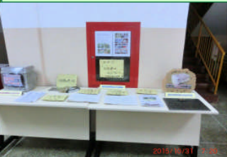
創立 30 周年、10 年前のタイムカプセルの中味の展示です。