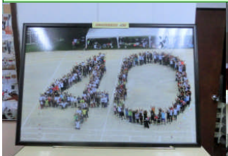
創立 40 周年記念運動会人文字の写真額です。迫力の写真額。