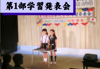
①はじめの言葉 小学部 2 年 元気いっぱい挨拶でスタート